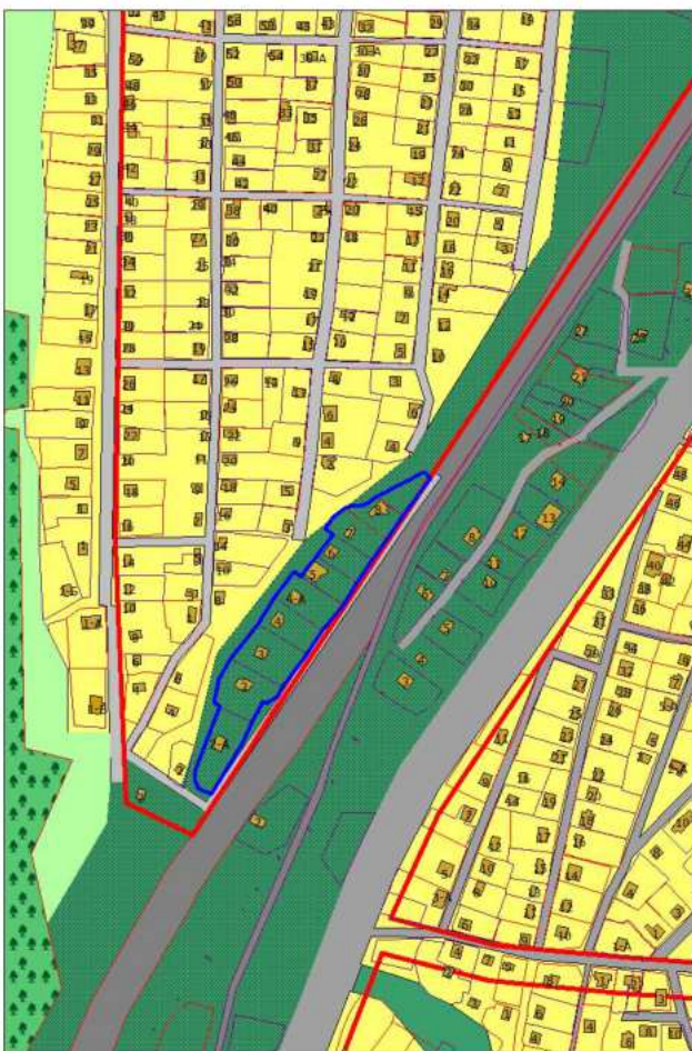
Фрагмент проектного плана города Новокузнецка