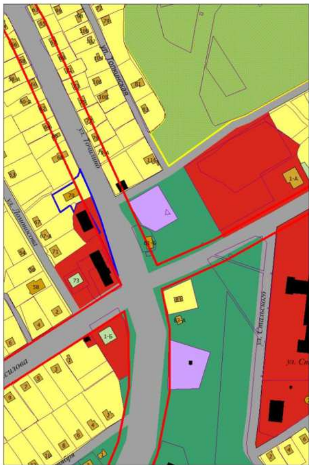
Фрагмент проектного плана города Новокузнецка