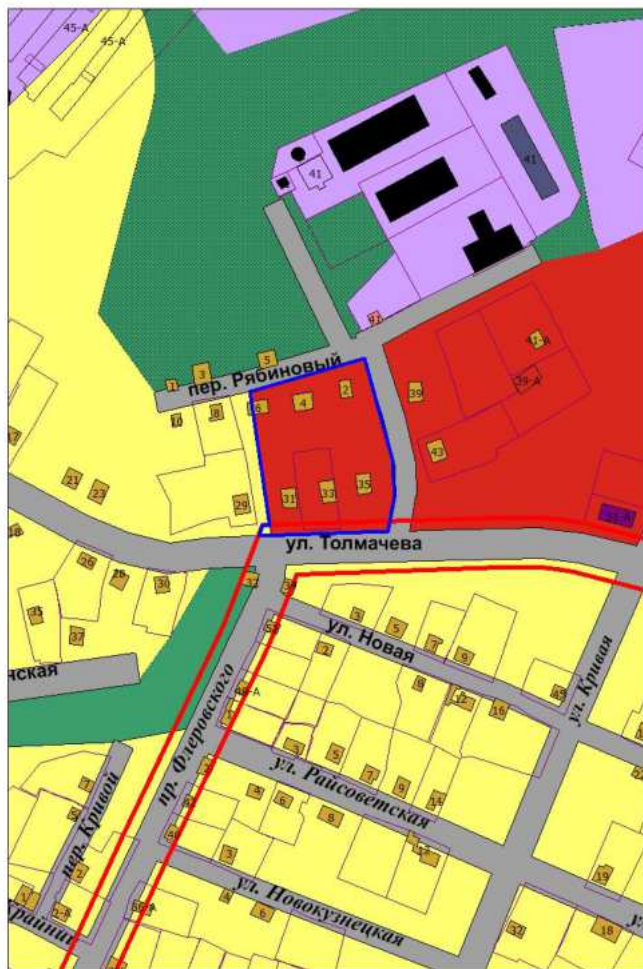
Фрагмент проектного плана города Новокузнецка