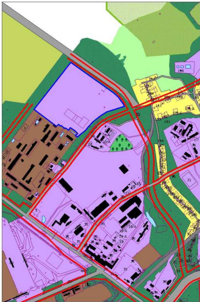
Фрагмент проектного плана города Новокузнецка