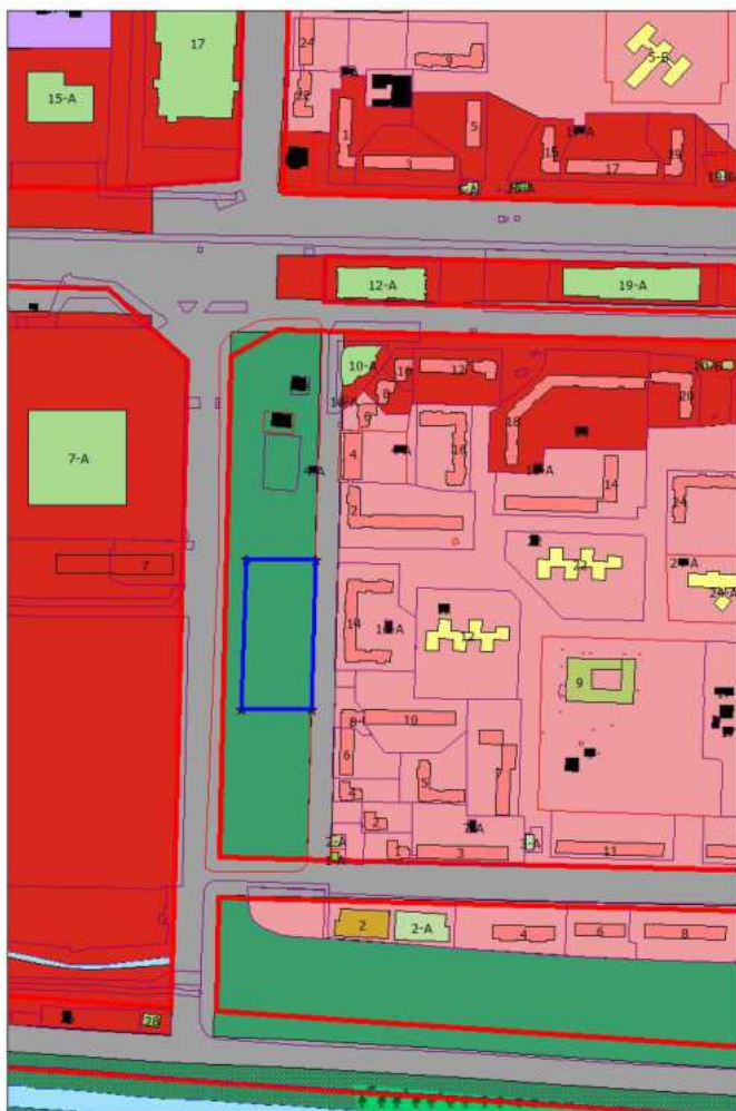
Фрагмент проектного плана города Новокузнецка