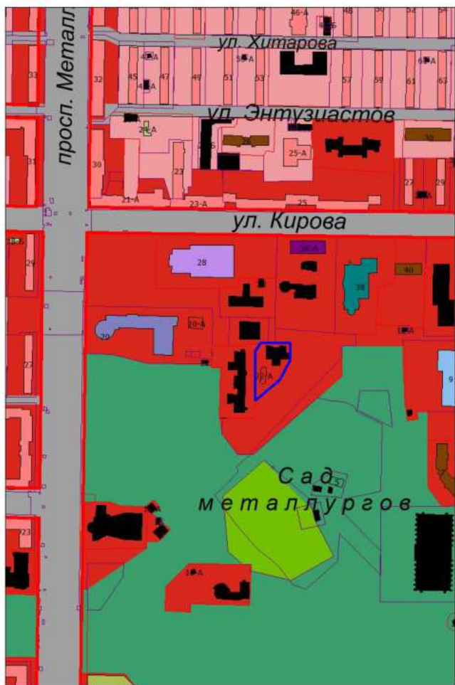
Фрагмент проектного плана города Новокузнецка