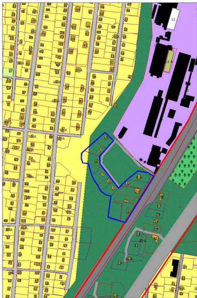
Фрагмент проектного плана города Новокузнецка