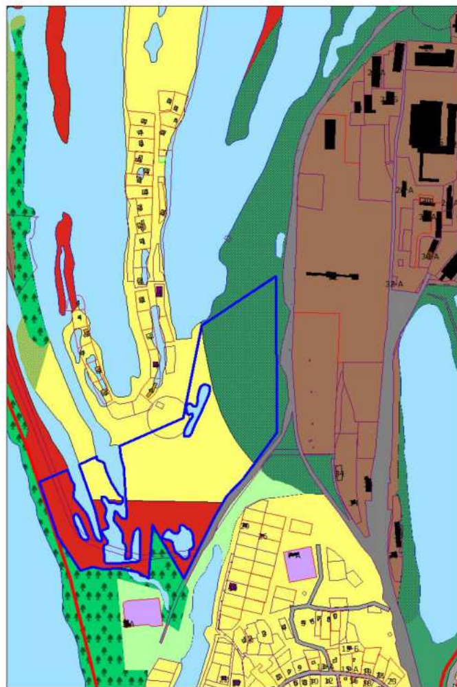
Фрагмент проектного плана города Новокузнецка