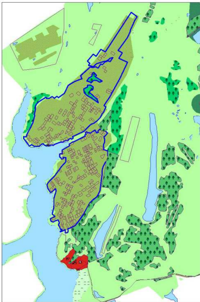
Фрагмент проектного плана города Новокузнецка