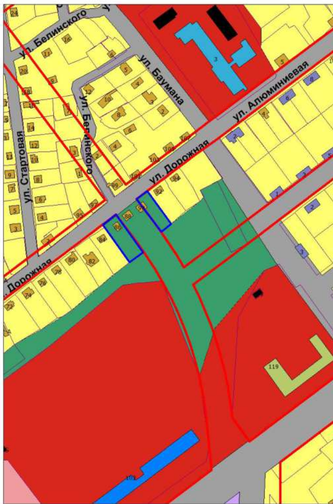
Фрагмент проектного плана города Новокузнецка